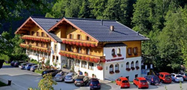
Salzburgerhof Bacher KG

Hotel Salzburger Hof Familie Bacher A-5652 Dienten am Hochkönig, Dorf 6 Tel. +43 6461 / 217-0 Fax +43 6461 217 31 hotel@salzburger-hof.at www.salzburger-hof.at