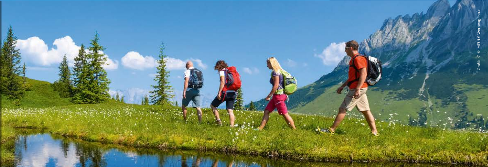
Grafik // © IMPULS Werbeagentur